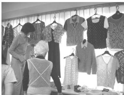
作品展はまるで商品のよう。

おしゃべりのこと、食べ物のこと……。ときには、おしゃべりに夢中になって編み目を間違えたり。かと思えば、各自の作品ファイルは本格的。細かい手先の作業ですが、80歳くらいから始めて作品を完成させた人もいます。「ここに来ると元気になれる」という参加者も。おしゃべり心を持ち続けることが、若さの秘訣のようです。