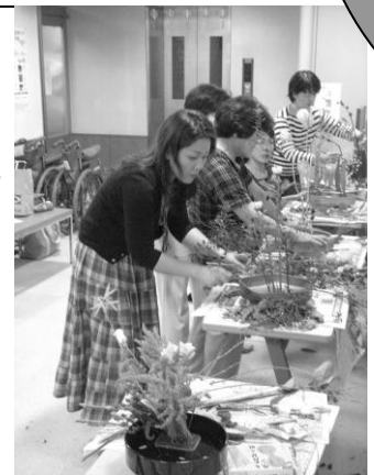
作品展に向けて真剣に生けこみ中。