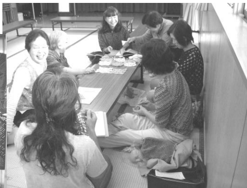
ワイワイ言いながらの作業が楽しい。