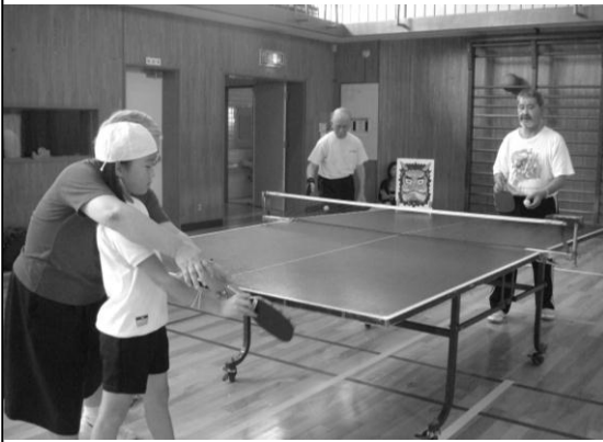
絵を描いた的を狙ってコントロールの練習。 小学生と一緒にピンポン玉リレー。

清和小学校との交流は 3 年生の「総合的学習の時間」の一環として 2004 年から始まり、