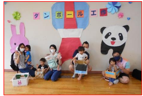
ママやパパと作った段ボール電車で線路を走り踏切を通り楽しく遊んだ手作り工作の時間でした！