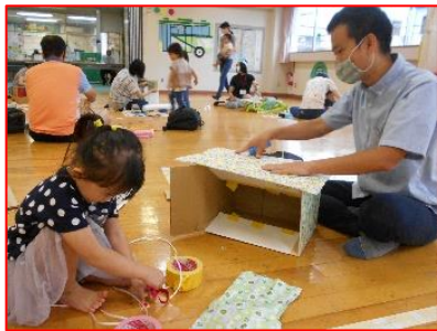
お父さんと一緒に頑張る！

「段ボール工作」も回を重ね、事前に構想を練って準備万端で電車づくりに臨むパパが多くなりました。日曜開館の賜物？