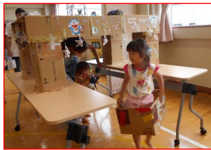
事業後なかなか壊すことができなかった人気のトンネル(*▽)