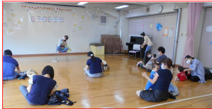
ソーシャルディスタンスをキープして広びろ！フフ♪