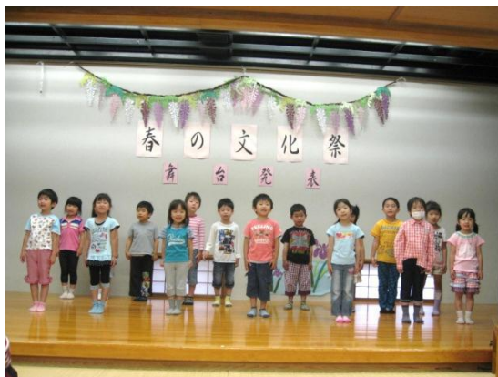
可愛い園児たちの歌と手話が披露されました。