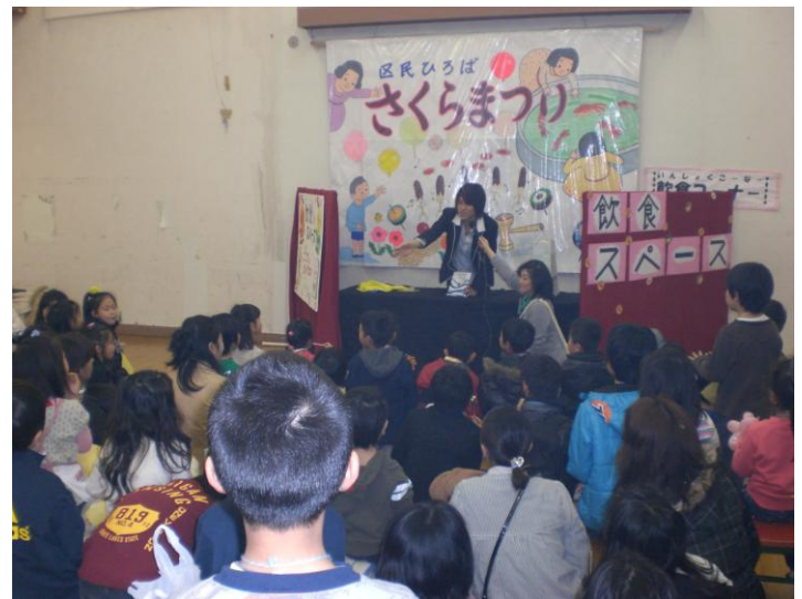
1階縁日ひろば 高校生によるマジックショー