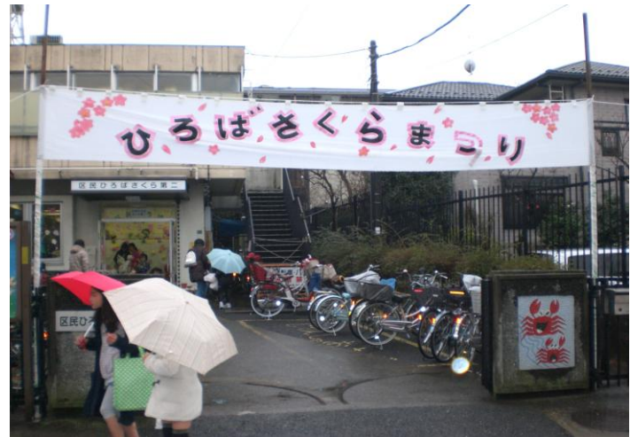
雨の中、ひろばさくらまつりの始まり始まり～！！