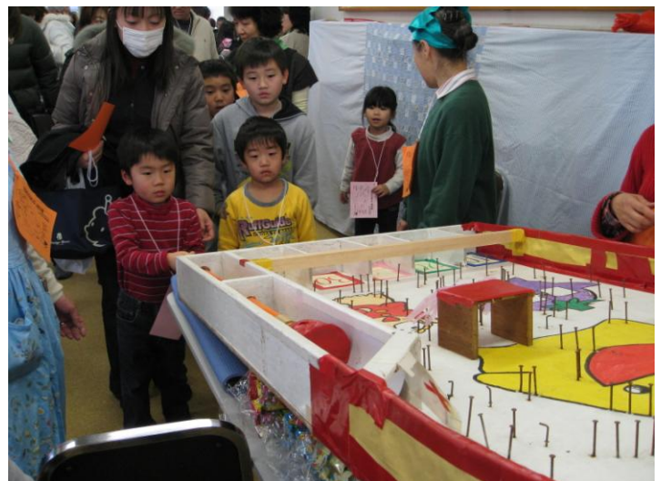
2階 コリントゲーム 目指せ高得点！