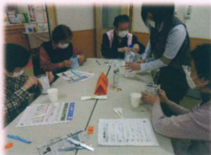
SDGs 研修 令和3年 10月 16日 (土) 主催：特定非営利活動法人ソメイヨシノの里ひろば駒込