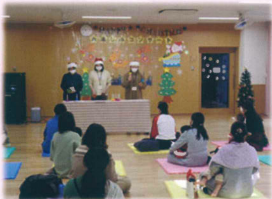
「 年末 お楽しみコンサート 」 令和3年 12月 22日(水)

NPO法人ソメイヨシノの里ひろば駒込の開設を記念してソメイヨシノを植樹しました。 植樹セレモニーは日を改めて行います