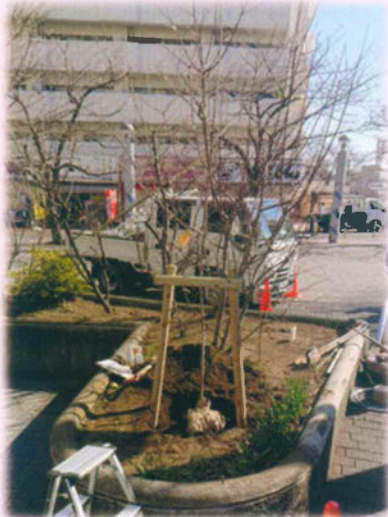
ソメイヨシノ桜 植樹 令和4年 2月 28日(月)

2021年4月より、区民ひろば駒込はNPO(特定非営利活動)法人 ソメイヨシノの里ひろば駒込として活動することになりました。しかしながら、2021年も新型コロナウイルス感染拡大防止のため活動が制限され、ご利用の皆様にはご不便をおかけしています。