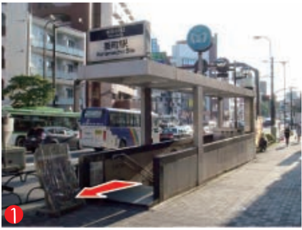
1 要町駅に着きましたら池袋よりの出口、5番出口を出てください。