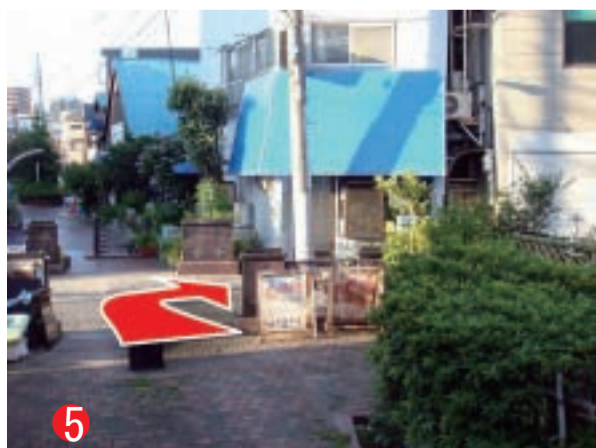
5 右手に青いテントの美容室が見えたらそこを右に曲がります。ここまで10分弱です。