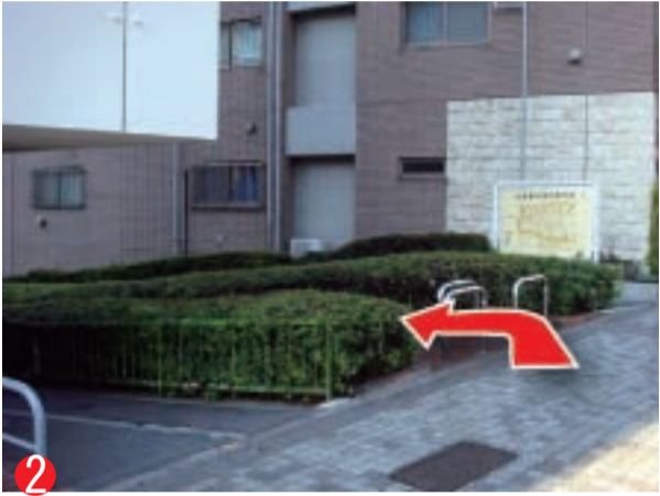
2 階段を上がるとすぐ左側に緑道入り口があります。谷端川緑道です。この緑道に入りしばらく歩きます。