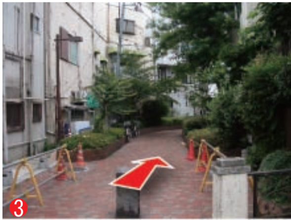
3 緑道をひたすら歩きます。