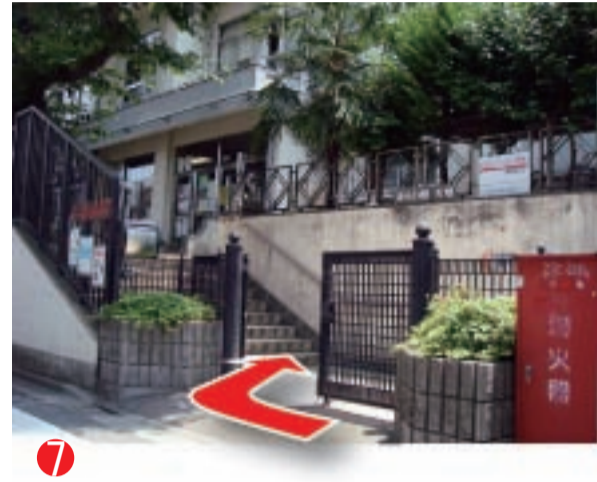
7 入り口です。ここまで要町駅5番出口から12分くらいです。