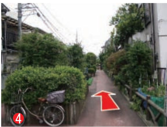
4 ひたすら歩きます。