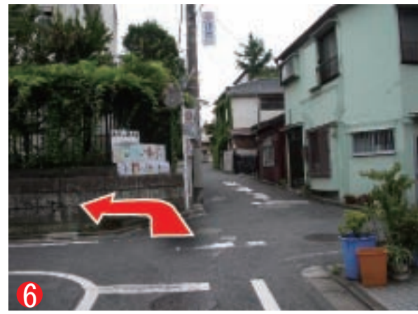
6 進行方向に学校の建物が見えます。ここがみらい館大明です。十字路を左に曲がります。