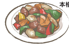
本格的！黒酢の酢豚