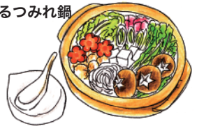
魚の三枚下ろしと 出汁からつくるつみれ鍋