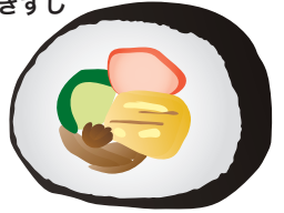
変わり手巻きずし