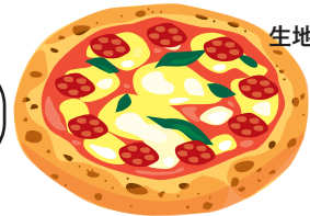
生地から作るピザ