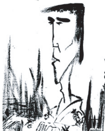
イラスト：三木のり平